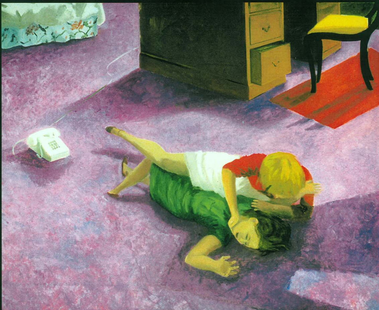
The Telephone , huile sur toile, 1988, 152,4 x 185,42 cm, © SODART (Montréal) 2002