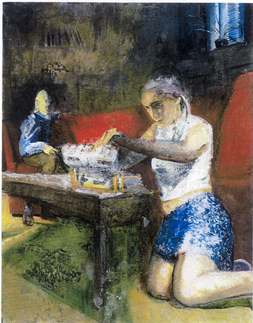
My Brother's Heart , huile, acrylique, pierre ponce, toile, 2000, 127 x 101,6 cm, © SODART (Montréal) 2002

démarche n'est peut-être pas celle que l'on pense de prime abord. L'artiste utilise cette possibilité qu'a la peinture de s'évoquer elle-même. Cette dimension est particulièrement manifeste dans The Blue Living Room , une œuvre dans laquelle la référence à la couleur bleue s'adresse tant à la peinture elle-même qu'à sa dimension picturale et à une particularité anecdotique de celle-ci. Scott est passée maître dans l'art de sous-tendre une action, un motif psychologique,