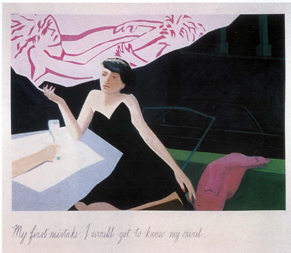
My First Mistake: I Would Get to Know my Rival , huile sur toile, 1983, 147,32 x 172,72 cm, © SODART (Montréal) 2002